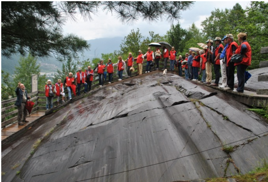
(In visita al Parco dei Graffiti di Naquane)

E' così arrivato il momento dei saluti e degli arrivederci alla prossima!